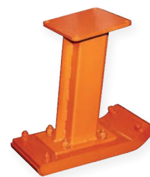
165 mm de ancho X = acero y madera