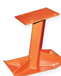
165 mm de ancho XA = completamente de acero